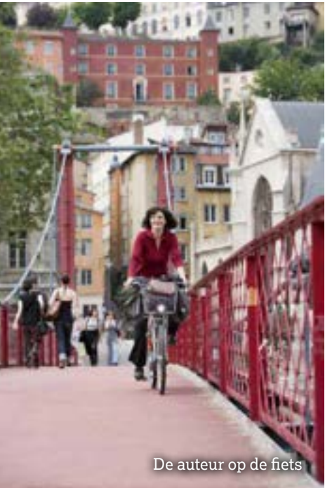
De auteur op de fiets