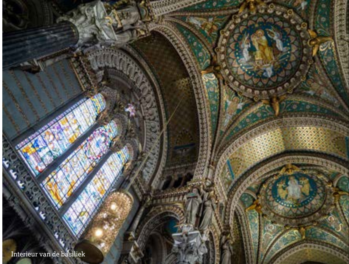
Interieur van de basiliek