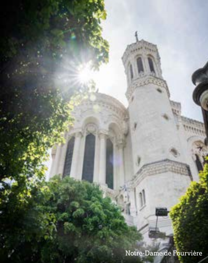
Notre-Dame de Fourvière