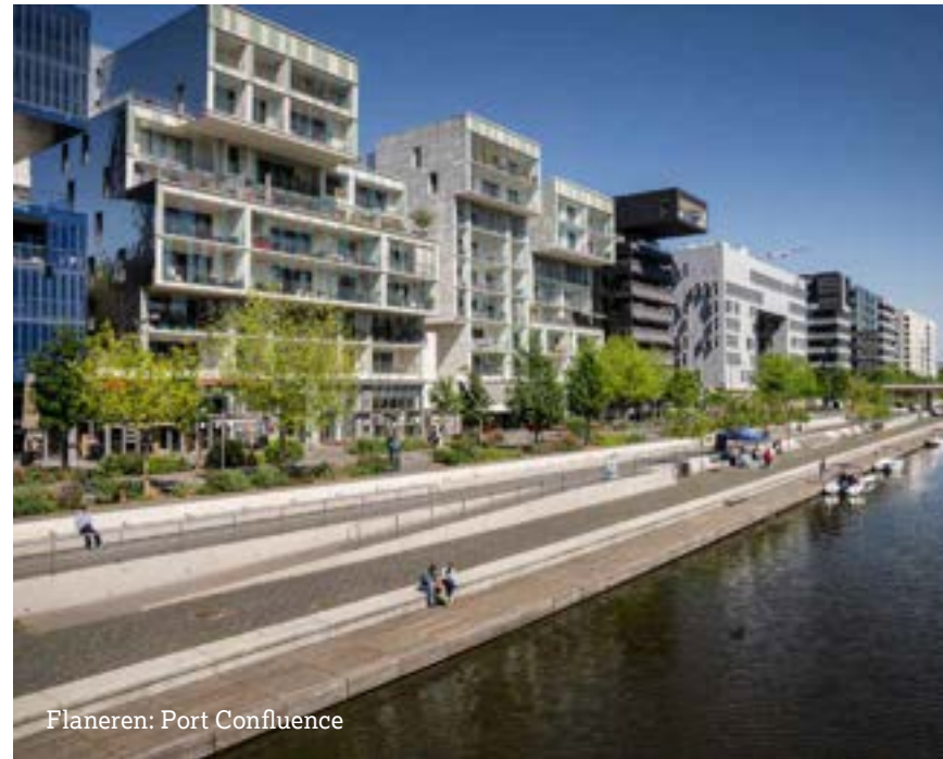
Flaneren: Port Confluence